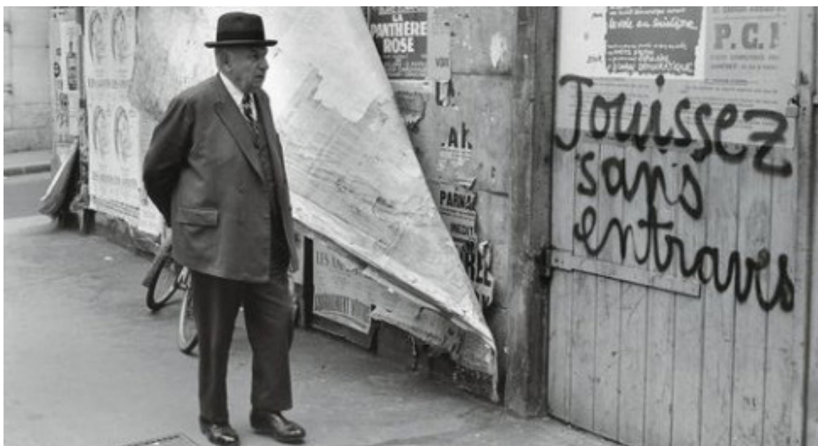
Rue de Vaugirard, 1968.

Nous voulons travailler sur une diversité de récits, de positionnements, créer des contrastes forts entre les stratégies développées dans leur vie intime par chacune des femmes représentées, pour créer de l'humour, de la mise à distance, de l'ambivalence et que ce soit par ces contrastes que notre discours se dessine.