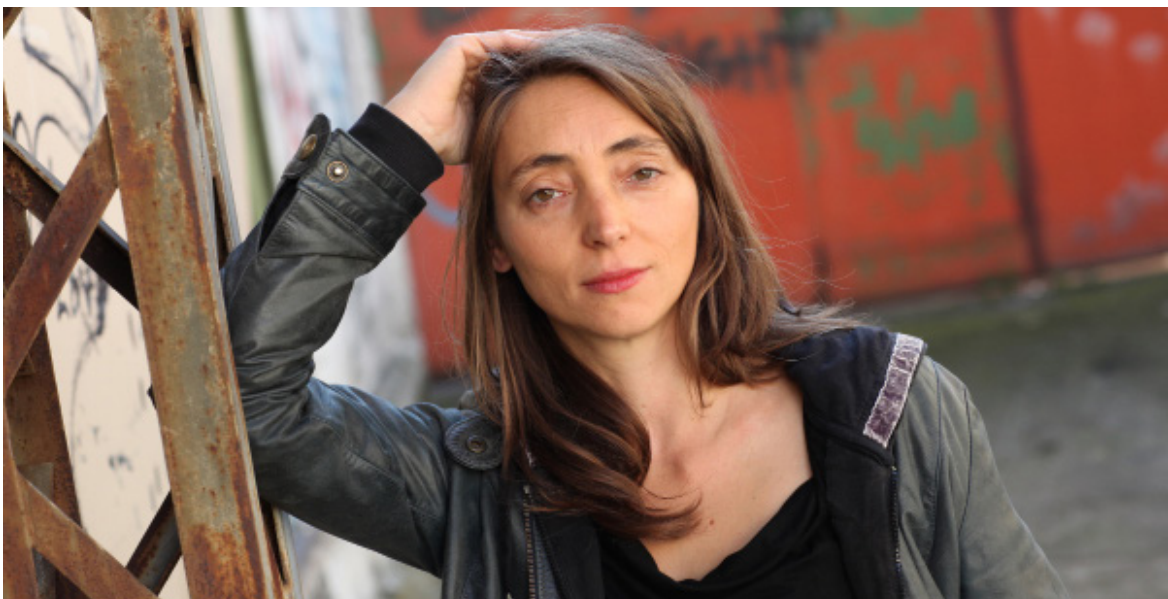
L'autrice Julie Gilbert.