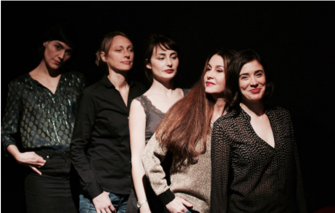
Femmes amoureuses (2017)